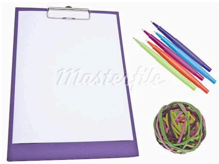
Папка тип Клипборд и гумени ластиси

Гумените ластиси са ефтин и лесен вариант, но не винаги може да се намери размер на ластика, които да прилепва стабилно, за да не се размества при писане.