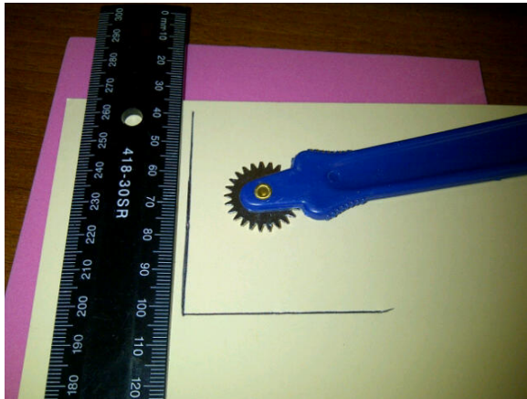
Инструмент за ембосинг (tracing wheel)

Къде? Този инструмент можете да намерите в магазините за професионални уреди и консумативи за шиене. С него могат да бъдат направени и други тактилни помагала.